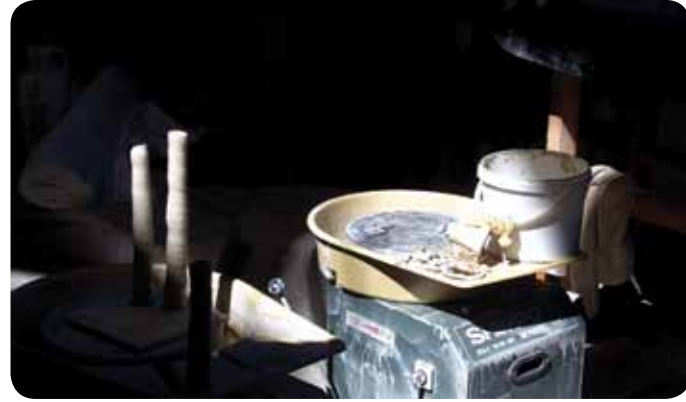
KAPALI DEVRE // Closed Circuit, 2011 120x94cm