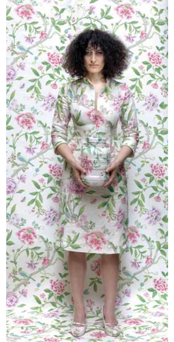
ÖNGÖRÜLEMEYEN DÖNÜŞÜM // Unforeseen Transformation, 2011 Yerleştirme, Seramik//Installation, Ceramic