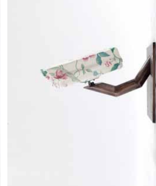
HERŞEYİN BİR ZAMANI VAR // Everything Has Its Own Time, 2011 Video Süre/Duration: 12 dak./min.